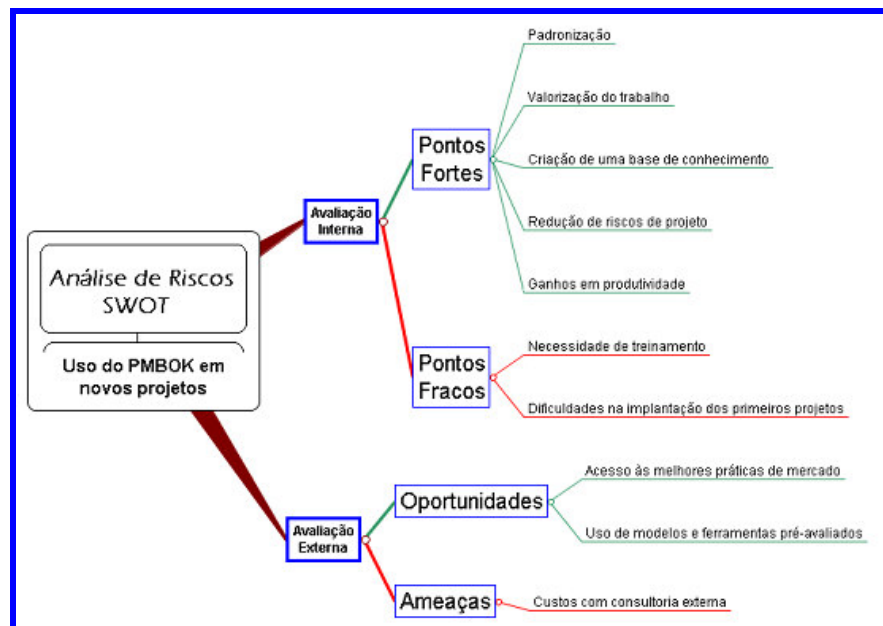
Quadro 2 – Diagnósticos dos ambientes internos e externos.

O Trader poderá, igualmente, diagnosticar e avaliar os fatores exógenos da organização ou da empresa, analisando as Oportunidades e Ameaças que surgem do Ambiente Externo. São análises mais complexas, pois envolvem questões das quais as organizações ou empresas não têm controles, pois tais fenômenos e circunstâncias são manifestados sem o controle das mesmas.