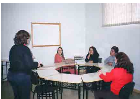
Figura 4: Orientação aos familiares na área da psicologia

Vale ressaltar que, na época, as expectativas dos familiares ainda recaíam sobre o desenvolvimento da oralidade, demonstrando uma forte resistência para a aceitação da Língua de Sinais, para seus filhos. Tal fato exigiu do projeto a organização de parcerias com os profissionais técnicos dos CEES, nas áreas do serviço social e da psicologia.