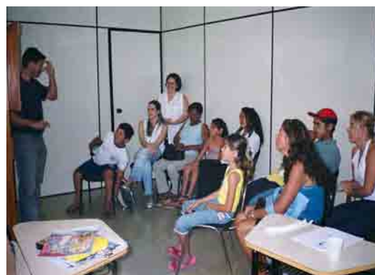
Figura 8: Vendo um filme no vídeo em Libras