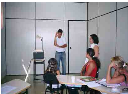
Figura 7: Dialogando em Libras