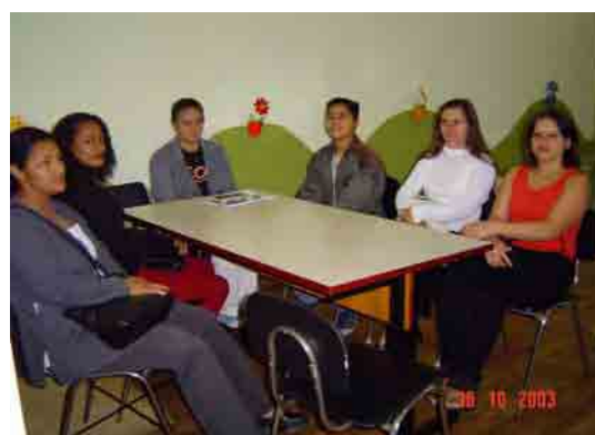
Figura 5: Reunião com os familiares dos participantes surdos